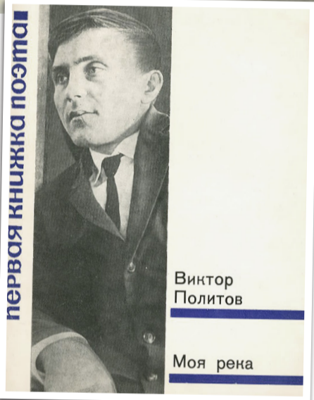
первая книжка поэта