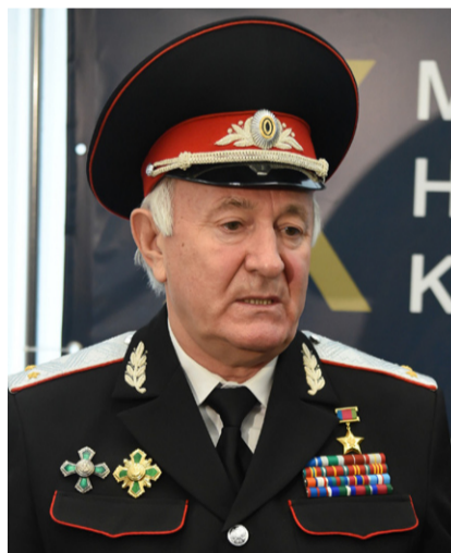
Уважаемые старики, господа атаманы, братья-казаки!

Сегодня важный день в истории современного казачества – мы отмечаем 29-ю годовщину принятия закона «О реабилитации репрессированных народов», в том числе и казачества.